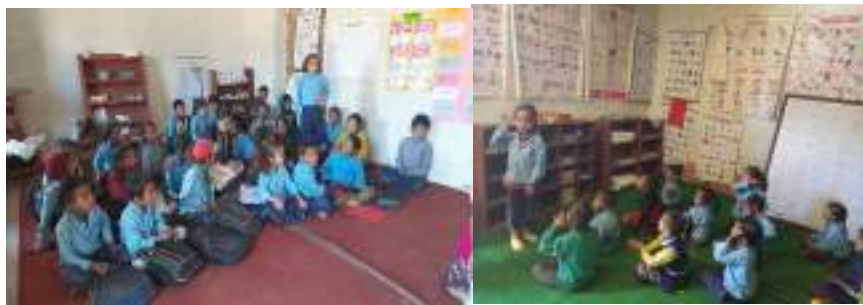
कक्षा कोठामा नानीले कथा सुनाउँदै

आइरहेको छ । विद्यालयमा बालबालिकाको लागि अनुकूल र सिकाई युक्त वातावरणको सिर्जना गर्ने तथा बालबालिका मैत्री छापामय वातावरणको