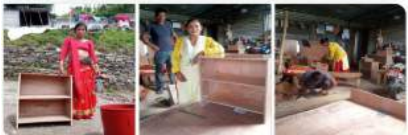
अभिभावक शिक्षा कार्यक्रम चलायत अभिभावक प्रभावित भयर पढाइको लागि न्याक बनाउदै/ लिदै ।

अभिभावक कक्षा सञ्चालन पछि अभिभावक आफै उत्प्रेरित भएर घरमा आफ्ना बालबालिकाहरुलाई समय दिन थालेका छन् । आफ्ना साना बालबालिकाहरुलाई पढाउने, बालबालिकाहरुलाई दन्त्य कथा सुनाउने बालबालिकाहरुबाट कथा तथा अन्य कुराहरु सिक्ने गरेका छन् । आफ्ना बालबालिकाहरु विद्यालय पछि घरमा पढाईलाई निरन्तर दिन्छन् कि दिदैनन् पढ्छन् कि पढ्दैनन्, उनीहरुलाई आवश्यक पर्ने शैक्षिक सामग्रीहरु छन् कि छैनन् आदि विषयमा स्वयम् अभिभावकहरुले नै ख्याल गर्ने गरेका छन् । अभिभावकहरुले