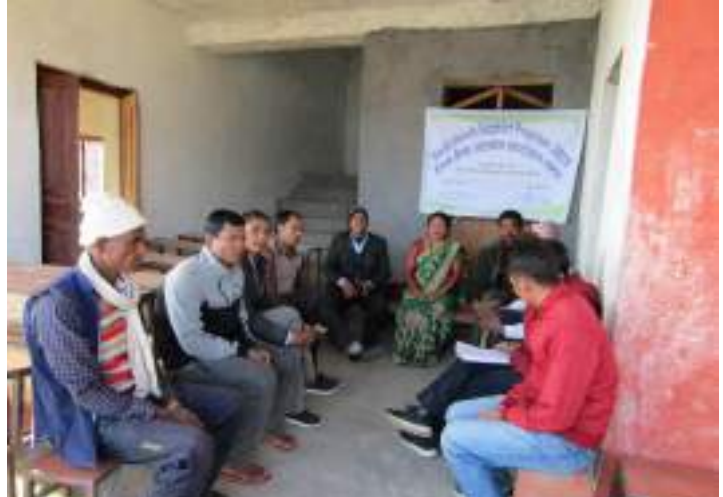
डेस्क बेन्च हस्तान्तरण कार्यक्रम