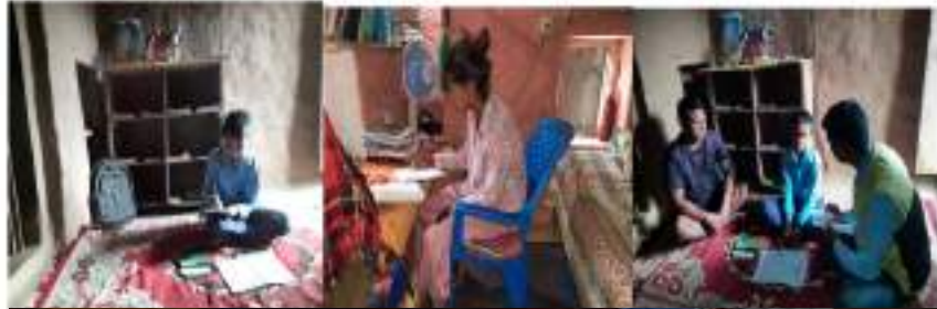
घरमा पढाईकुना निर्माण पछि बालबालिका पढ्ने अभिभावकले सहयोग गर्दै गरेको फोटो

बालबालिकाहरूले घरमा पढाईकुनामा राखिएको किताबहरू पढ्ने गरेका छन् । हरेक घरमा पढाई स्थानको व्यवस्थापन र निर्माण पछि बालबालिकाहरूले गृहकार्य पढाई कुना नजिक गएर गर्ने गरेका छन् । भने आफुले तयार गरेका सामग्रीहरू पढाईकुनामा राख्ने गरेका छन जसले साना बालबालिकाहरूलाई ठुला बालबालिकाहरूले घरमै सिकने सिकाउने कार्यमा सहयोग गर्ने