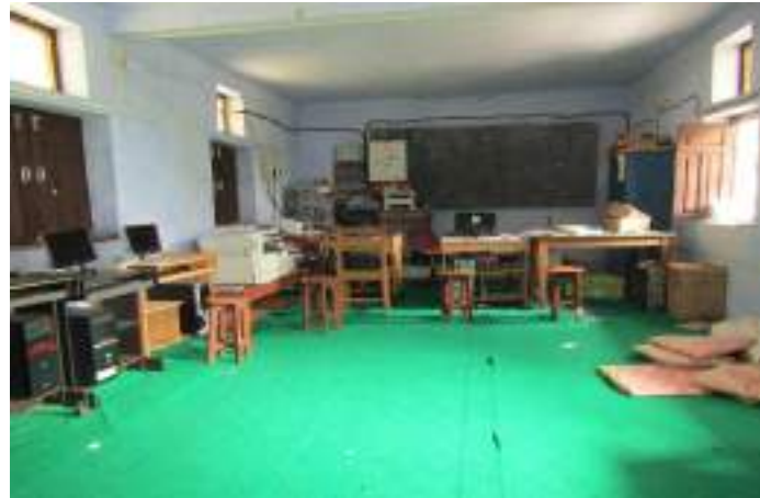
Before support only 5 computer which were not working properly