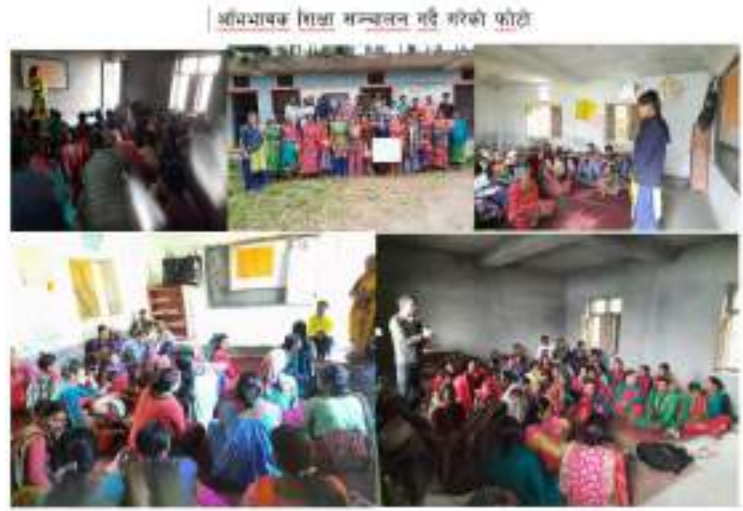
अभिभावक शिक्षा सञ्चालन गर्दै गरेको फोटो

अभिभावकहरुलाई अभिभावकको कर्तव्य बोध हुन जरुरी छ । बाजुरा जिल्लाको बुढीगंगा नगरपालिकाका कतिपय अभिभावकहरु सामान्य साक्षर मात्र छन् जसलाई अभिभावकको कर्तव्य पुर्ण रुपमा थाहा नभएको देखिन्थ्यो । अभिभावकहरुलाई तिनिहरुको कर्तव्य प्रति जागरुक गराई बाबु, नानिहरुको शैक्षिक प्रगती स्वास्थ्य तथा सरसफाई र समग्र विकासमा ध्यान दिने बनाउनको लागि अभिभावक शिक्षा आवश्यक परेको हो । जुन अभिभावक शिक्षा तथा अभिभावक संचेतना कार्यक्रमहरु समुदायमा सञ्चालनमा ल्याईएको थिए ।