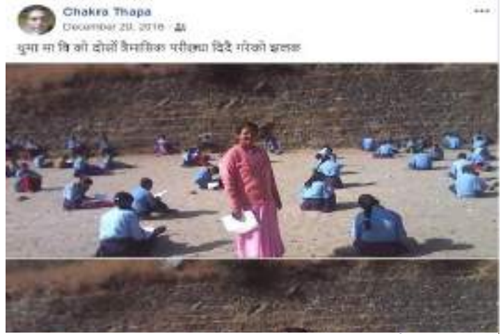
सहयोग पहिला विद्यार्थीहरु भुइँमा बसेर परीक्षा दिदै

यसरी विद्यालयलाई डेस्क बेन्च सहयोग हस्तान्तरणसंगै थुमा माध्यामिक विद्यालय परिवारमा खुसीयालि छाएको छ । विद्यालयको बसाई व्यवस्थापनमा पनि सहजता भएको छ । विद्यार्थीहरुले ५ जना एउटै बेन्चमा बस्नुपर्ने बाध्यता पनि हटेको