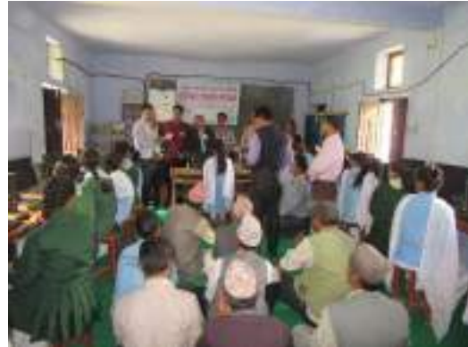
Computer and Equipment Support

way discussed about the situation of the school to District Education Office and Local government. After the discussion GNI made the decision to support the computer lab and ICT equipment for SMART classroom to school. PMC meeting also recommended to support the computers for computer lab and equipment for SMART Classroom. Finally, PeaceWin provided carpet and 15 computers to school for computer Lab in 2017 and