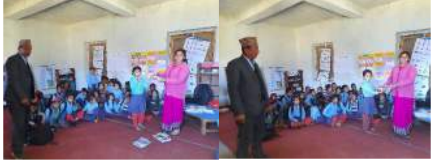
कथा वाचन पछि नानी कक्षाकोठामा सम्मानित हुदै