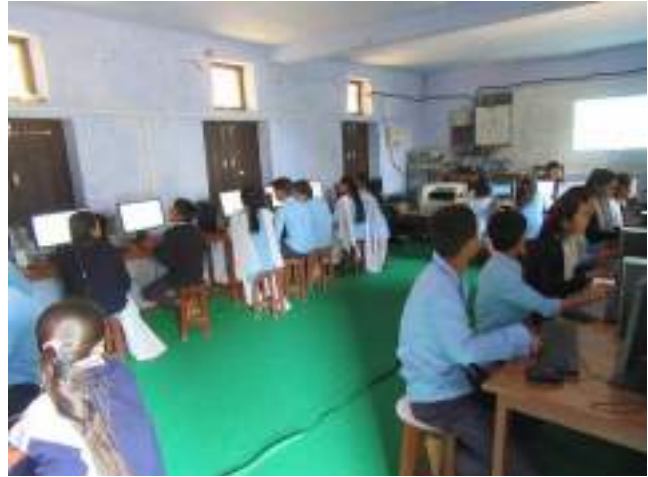
SMART Classroom with 26 computer

Bhanodaya Secondary School is located in Budhiganga Municipality 5 Bajura. Now days Bhanodaya Secondary School has a Computer Lab and available separate laptop for each teachers who need. There are 925 children studying in this school including 427 boys and 498 girls. There is computer lab with 26 computers and 8 SMART classroom. Manvir Khati is the principal and Chakra Thapa is SMC chairperson of this school. This school adapted ICT in education after our support and follows the plan of