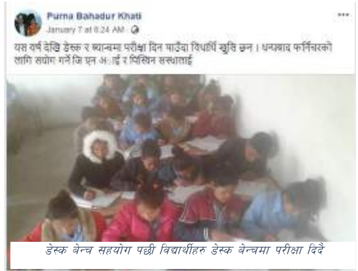
डेस्क बेन्च सहयोग पछि विद्यार्थीहरु डेस्क बेन्चमा परीक्षा दिदै