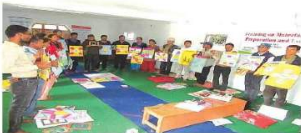
तालिममा सहभागी शिक्षक शैक्षिक सामग्री देखाउँदै।

विद्यालयका २८ जना शिक्षकलाई शैक्षिक सामग्री निर्माण र कक्षा कोठा व्यवस्थापन सिकाउने खास गिने तालिम पनि दिइएको छ। निर्माण